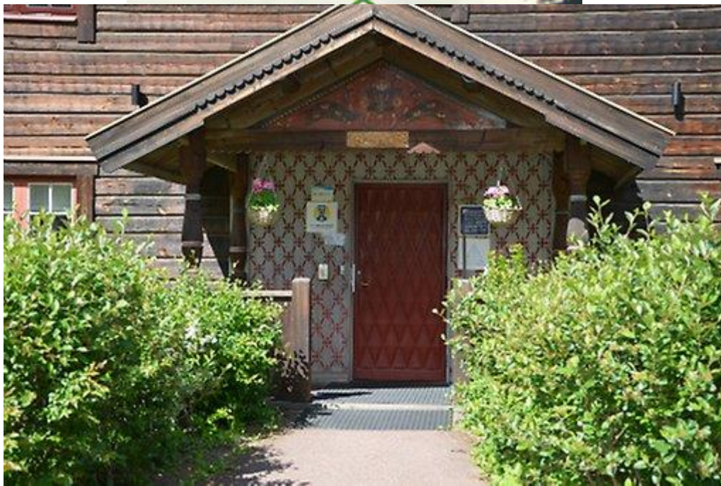
Rättviksgården Vandrarhem entré.