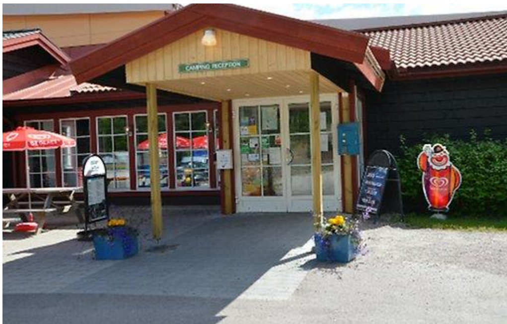
Rättviks Camping, Enåbadet entré.